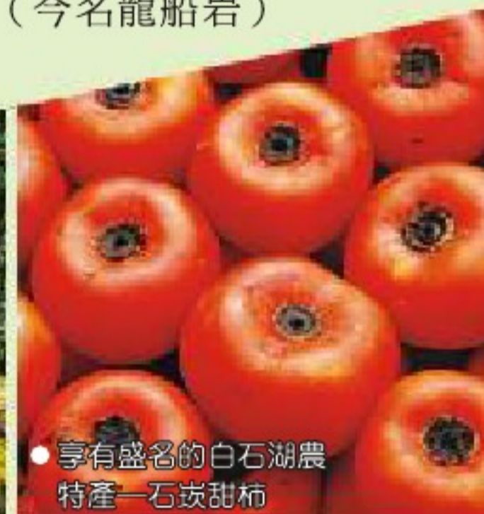
●享有盛名的白石湖農特產—石炭甜柿