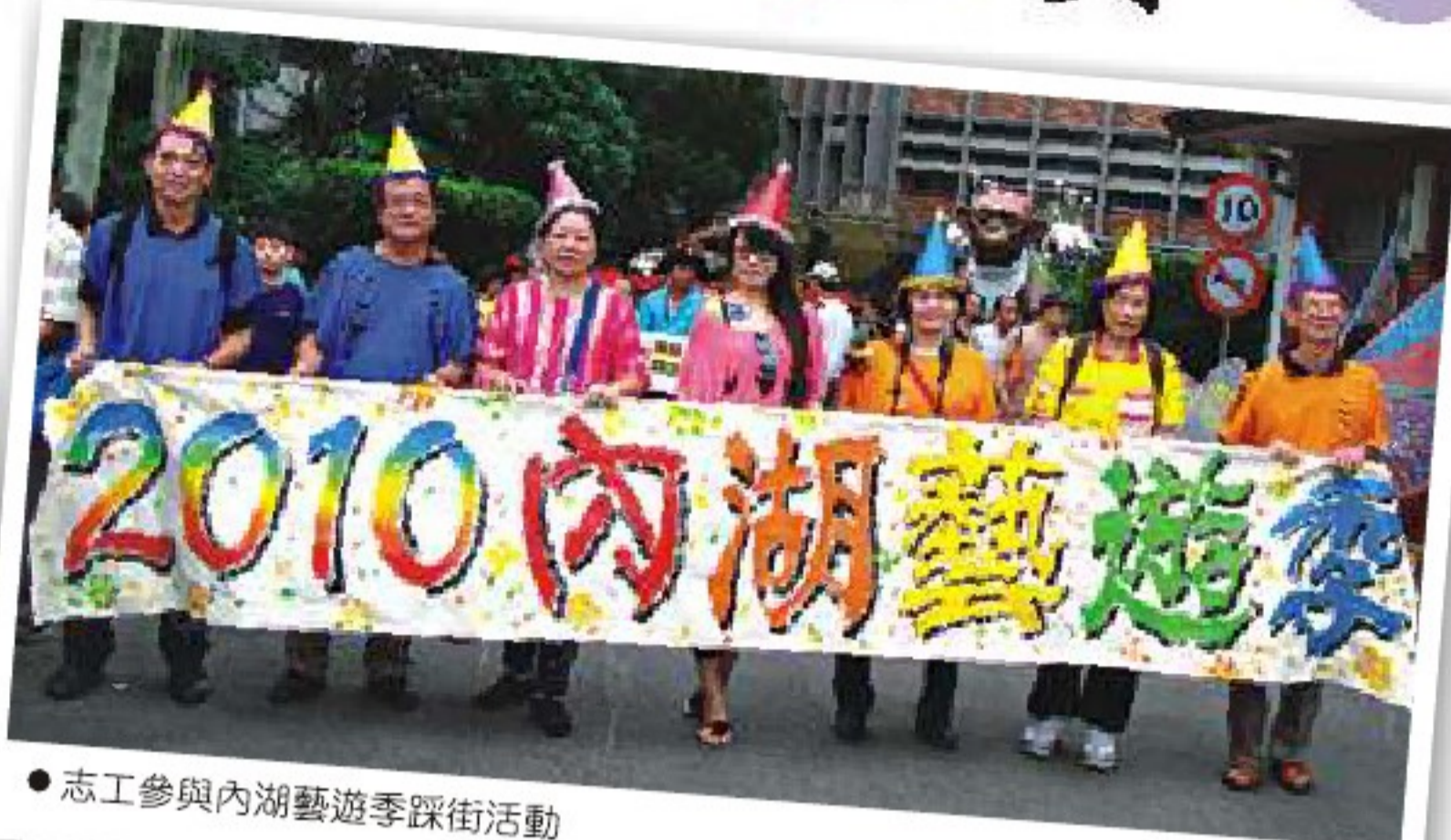
● 志工參與內湖藝遊季踩街活動

三段方濟中學沿途路人及店家都上街看熱鬧，在捷運內湖站，各隊伍的表演更是吸引了相當多的人潮，直到最後一支