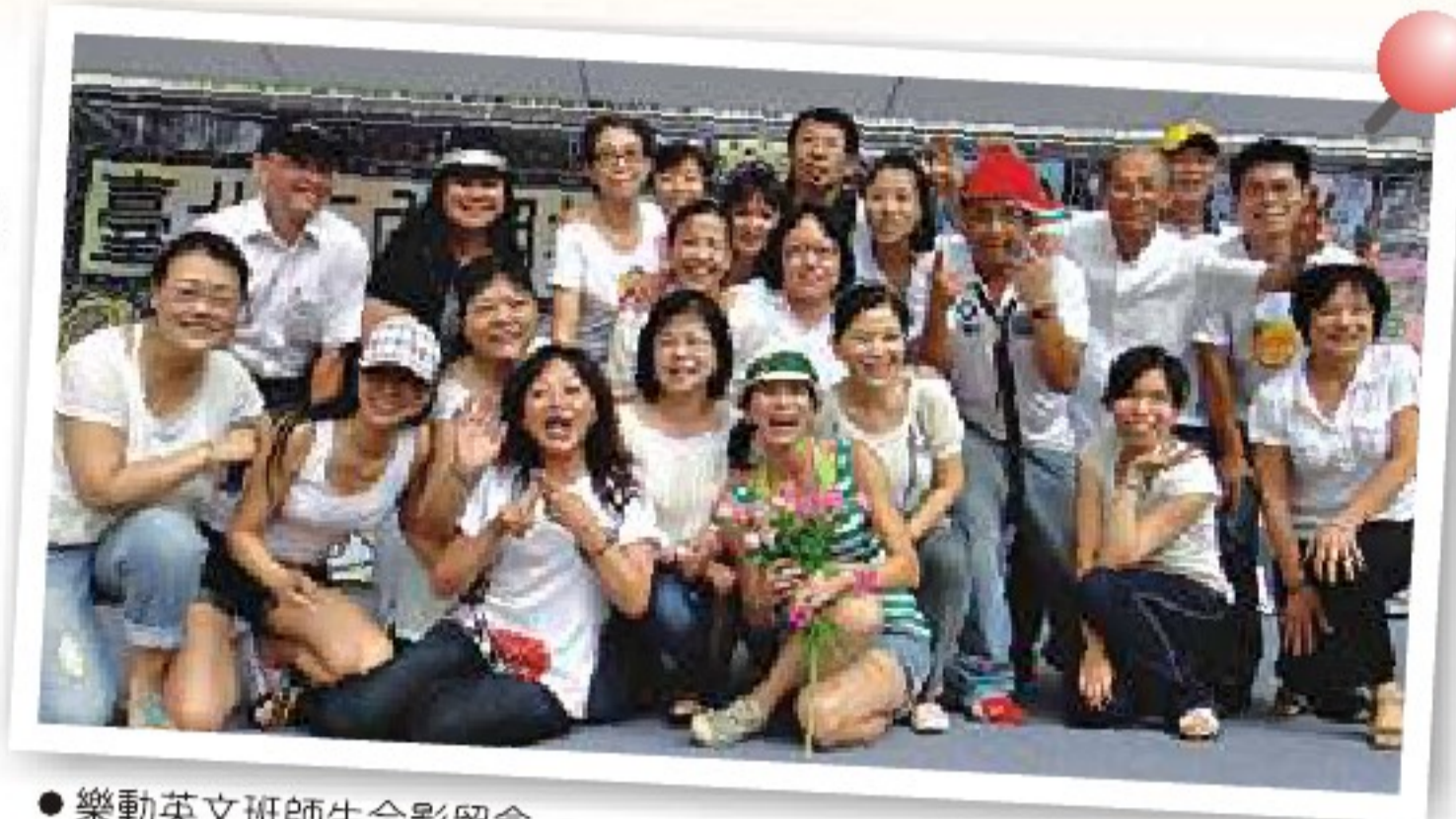
● 樂動英文班師生合影留念

這個班唱到現在有五年了，唱過阿巴的「Dancing Queen」(舞后)，瑪麗蓮夢露的「The River of No Return」(大江東去)，休葛蘭和海莉在K歌情人夢裡合唱的「Way Back Into Love」(重新找到愛)，艾爾頓強的「Circle of Life」(生生不息)，席琳迪翁的「The Power of Love」(愛的力量)，…… 我們選唱了20~21世紀許多好聽的歌，而且我們還要繼續選唱下去。