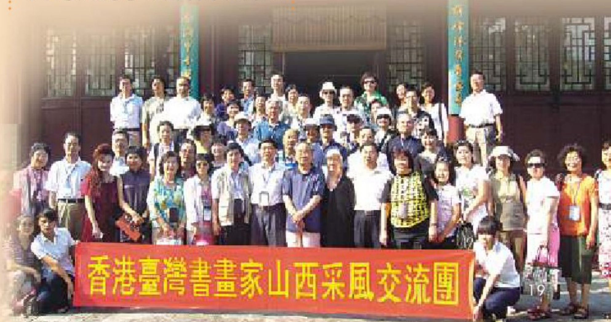
● 晉港臺書畫家交流合影

山西古蹟何其多，盡覽無餘時奈何。 三晉勝景何其闊，踏破鐵鞋難消磨。 采風時日雖有限，滿檔行程足奔波。 惜緣惜福同歡暢，餘處他日再張羅。 一路平安受照護，一場盛會喜融和。 藝文旅遊相連結，圓滿成就可詠歌。 惜別盛宴盡珍饈，杯觥交錯樂交流。 千里雲山擁抱後，珍重離別意難休。 全員登臺齊獻唱，歡喜此行慶豐收。 兩岸連心情義重，永恆懷念駐心頭。