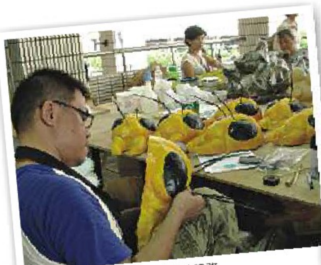
● 內湖藝遊季創作工作坊協助服務