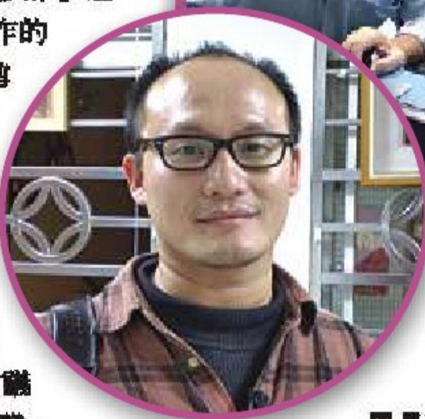
● 工作坊學員學習如何操作剪輯作業