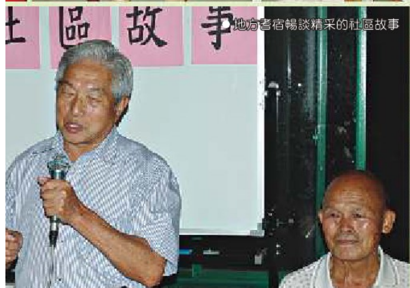
地方耆宿暢談精采的社區故事