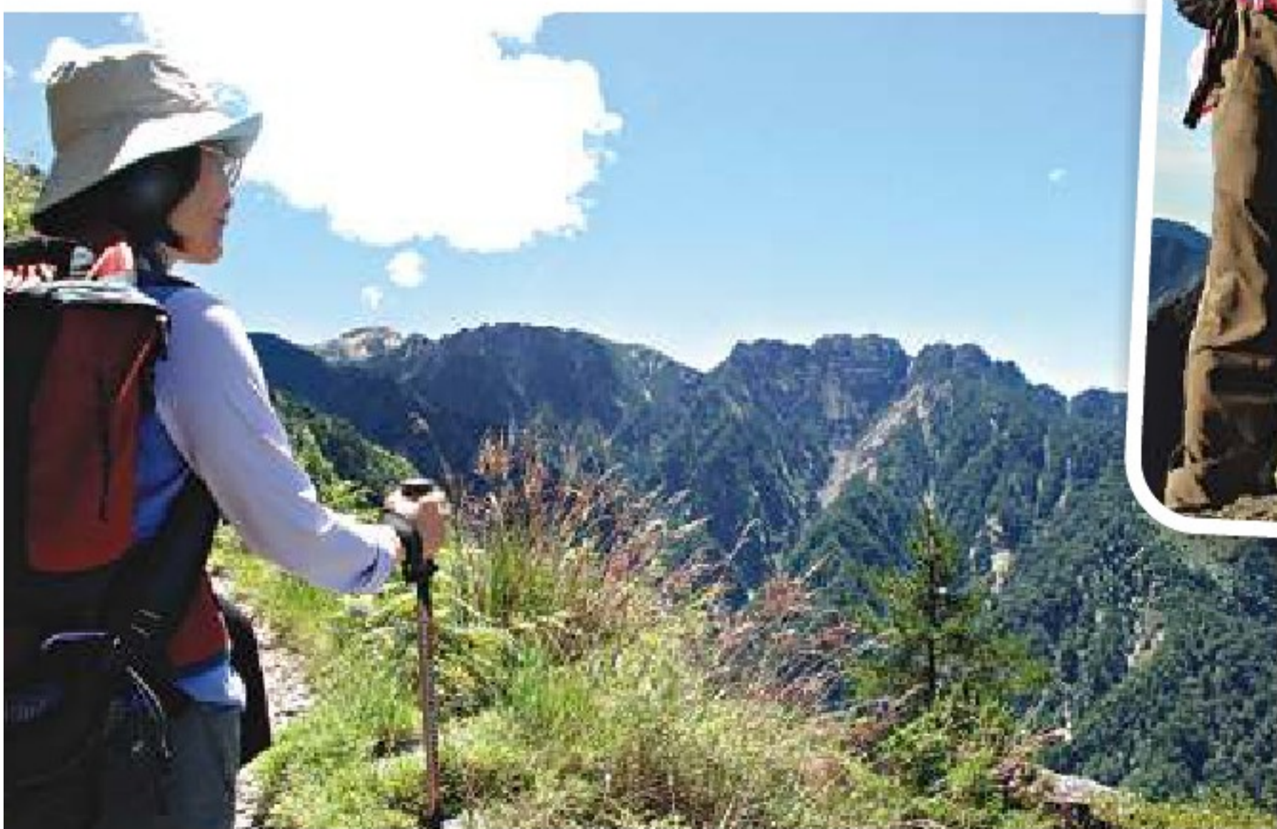
● 藍天、白雲及青山伴我行