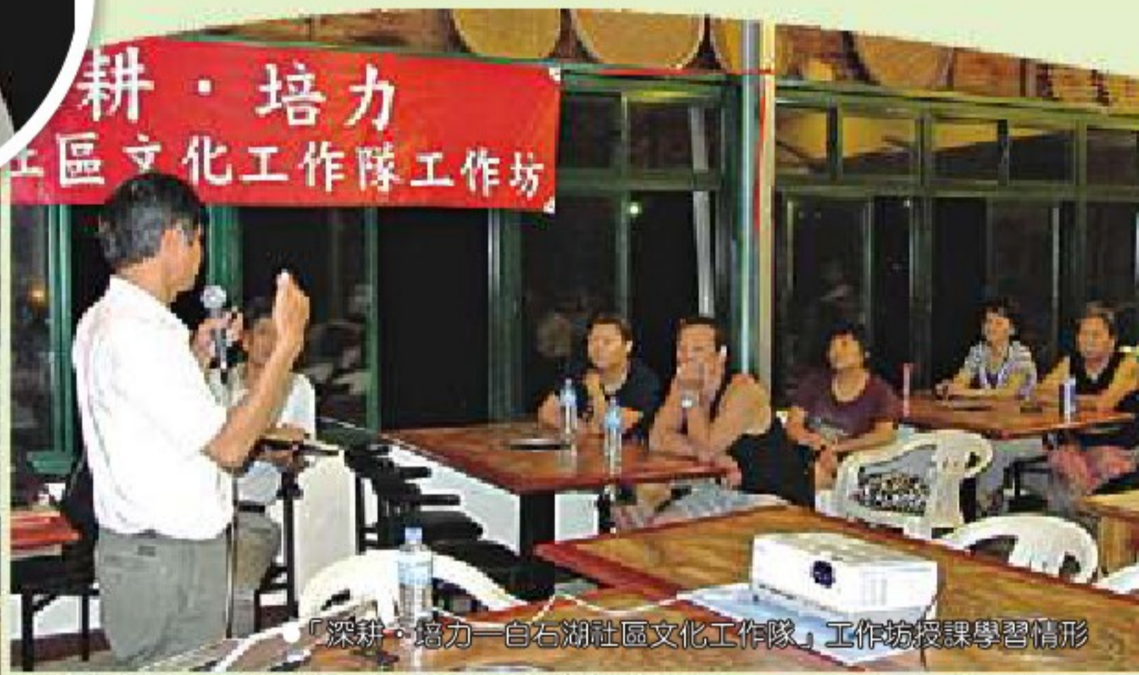
「深耕·培力—白石湖社區文化工作隊」工作坊授課學習情形