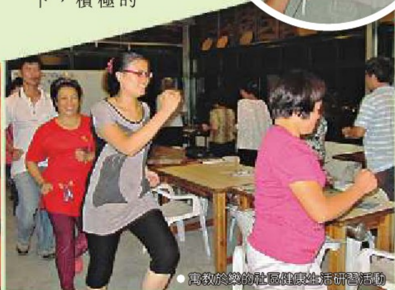
寓教於樂的社區健康生活研習活動