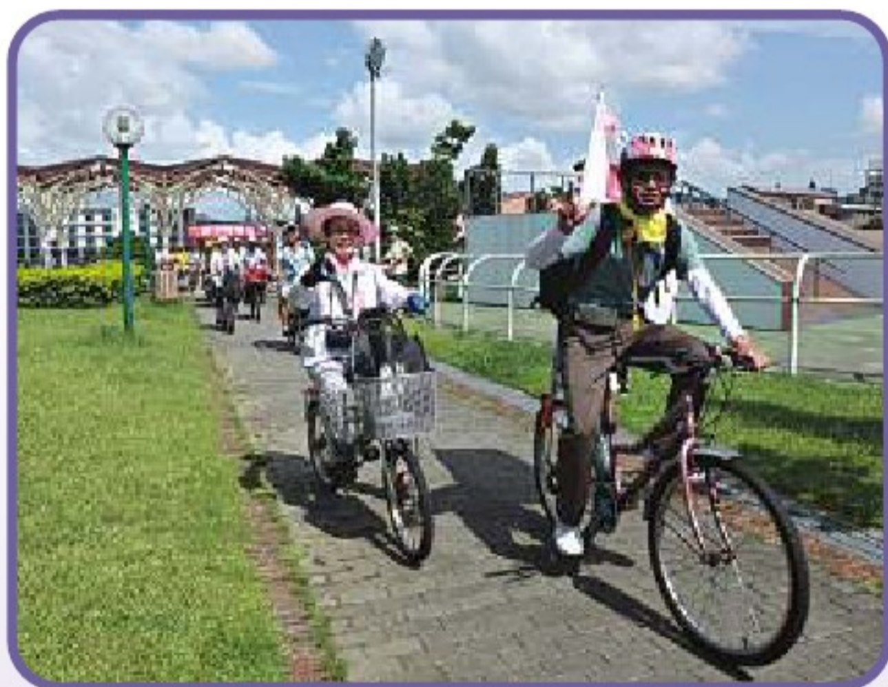
● 內湖山水單車綠生活市集活動交維服務

因為，有內湖社大給予服務人群的機會，我們是一群快樂的服務志工，而且彼此相處是和樂融融！