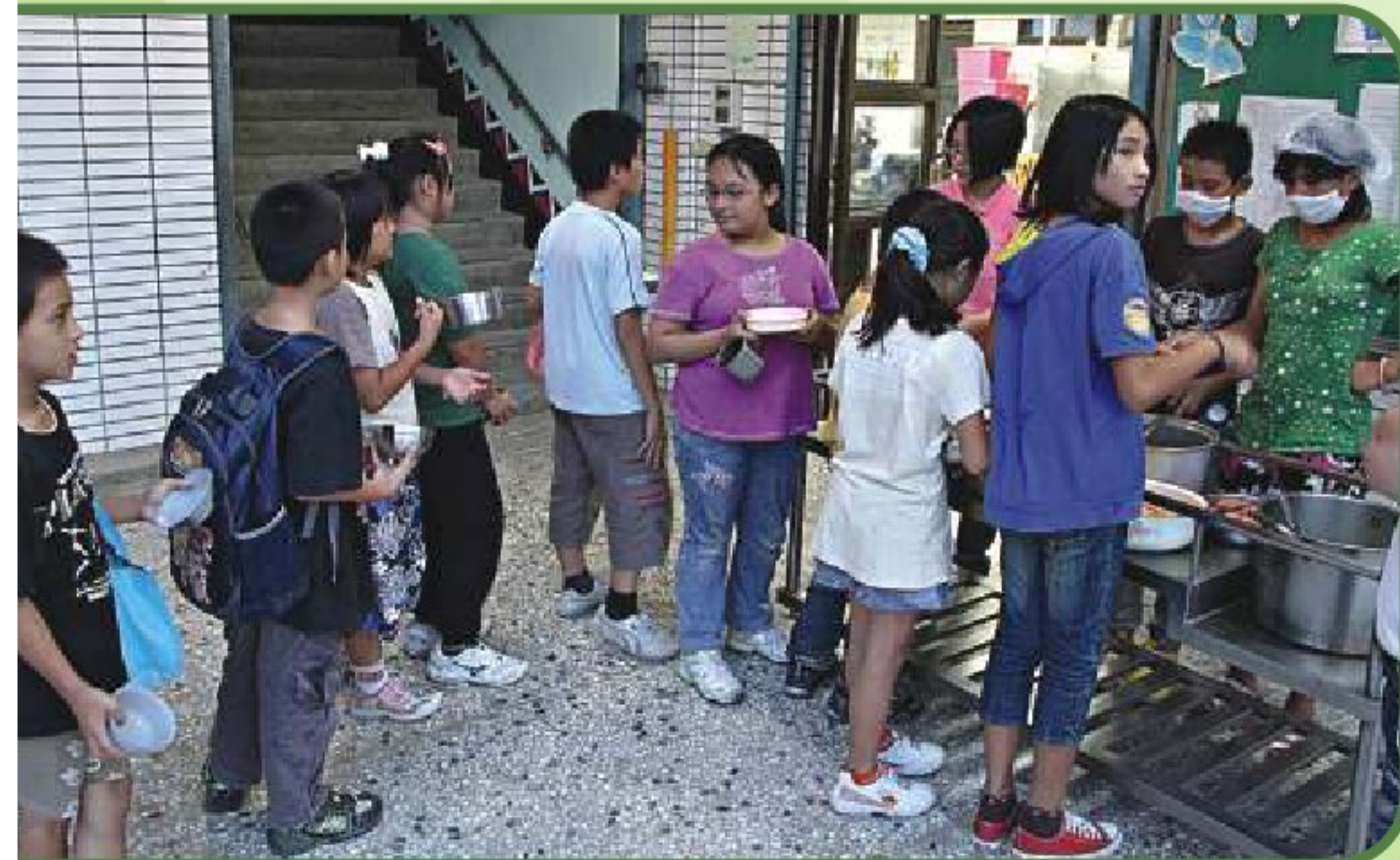
● 99學年開始本會補助西林國小課輔班晚餐，讓孩子在課輔前享用熱騰騰的晚餐。