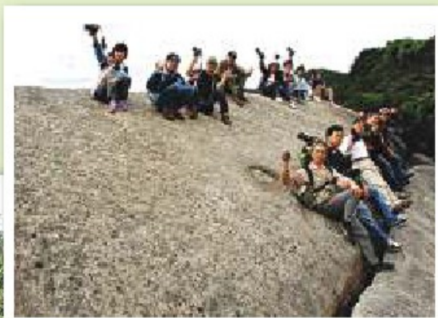
●特殊稜線地景—龍船岩（舊稱石船），係內湖舊八景之一。

於清乾隆52（西元1787）年3月，曾是林爽文同黨人林小文抗清事件中的古戰場，地勢險要。「碧山」一詞，係於日治大正13年9月24日，內湖庄長郭華讓題字命名的。區域內，更擁有日治時期，內湖舊八景中的尖頂（今名忠勇山）、石船（今名龍船岩）