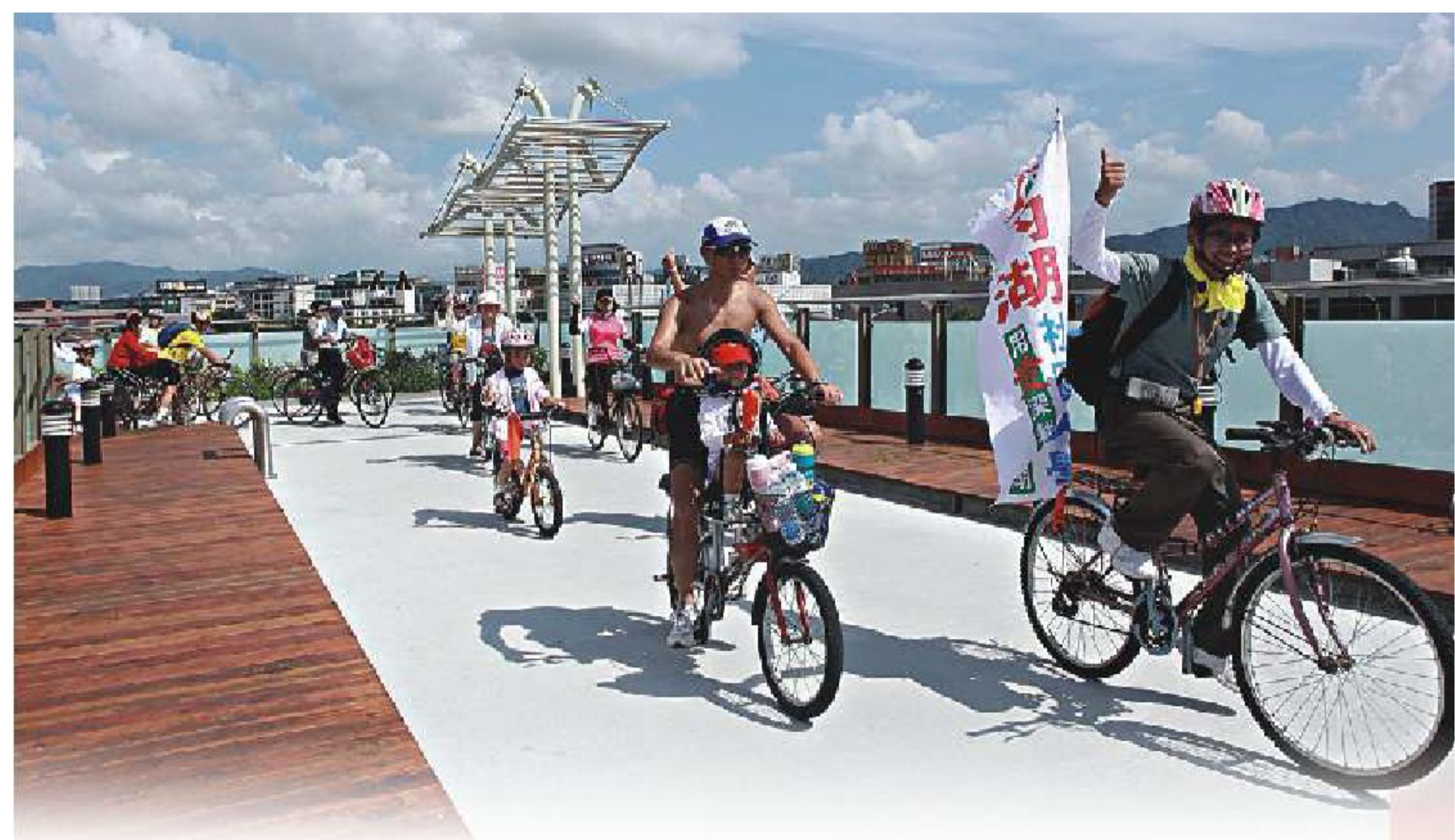
● 內湖山水單車綠生活快樂行