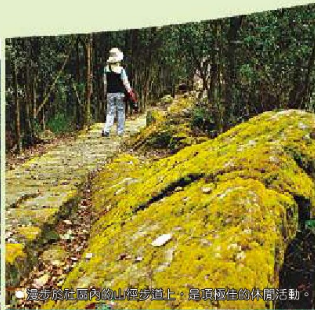
●漫步於社區內的山徑步道上，是項極佳的休閒活動。