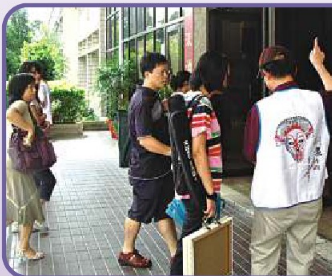
● 開學週教室導引服務