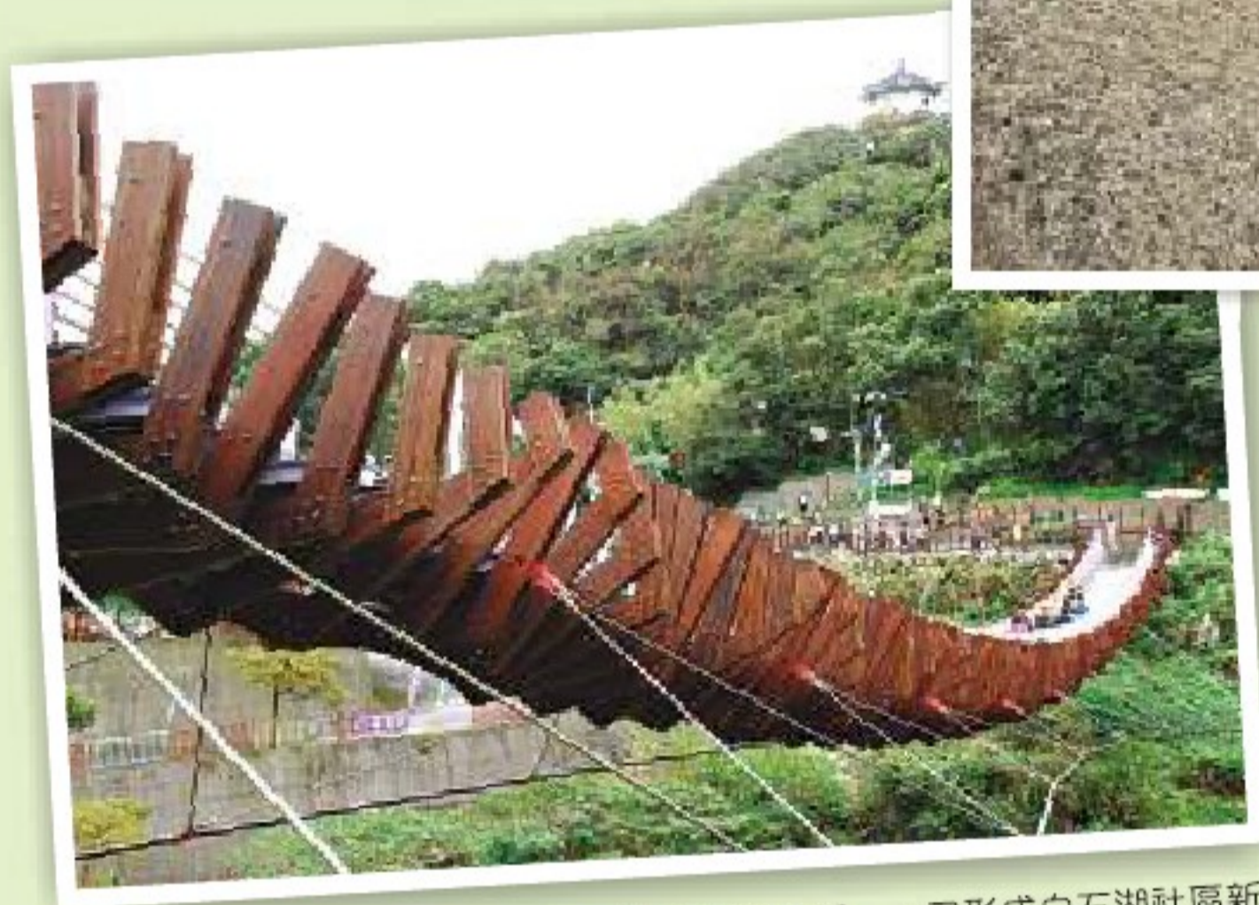
●今年春節新開放通行的龍骨型「白石湖吊橋」，已形成白石湖社區新的地標。