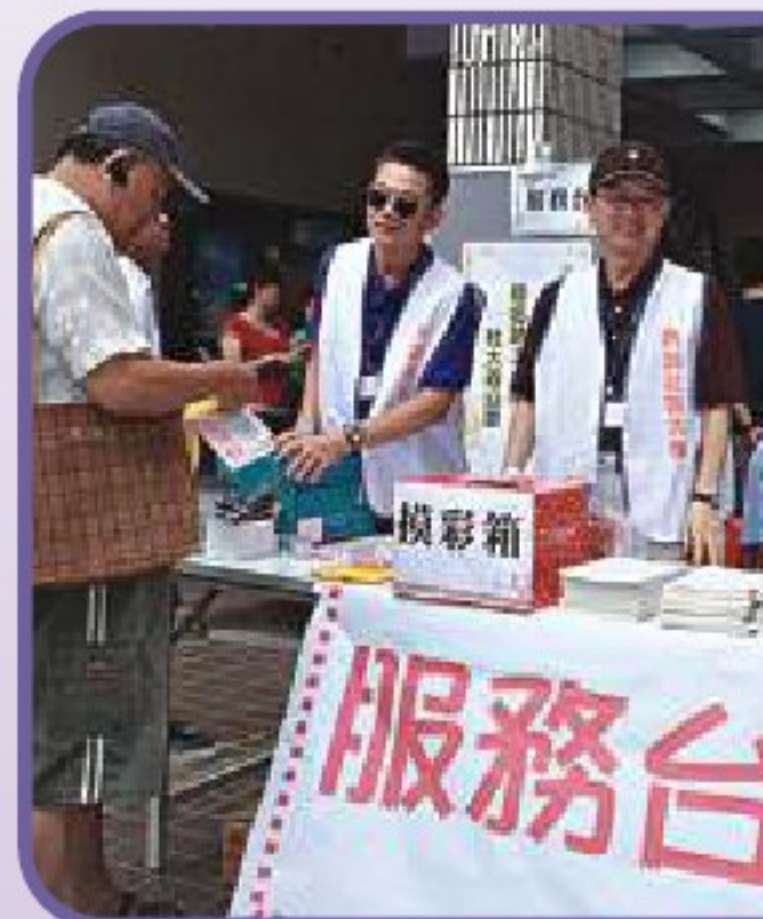
● 課程博覽招生服務