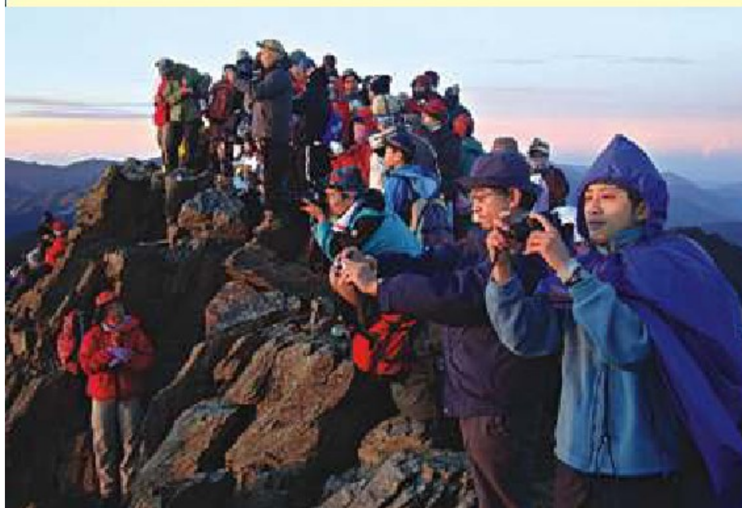
● 全隊登頂成功，完成了人生的夢想。