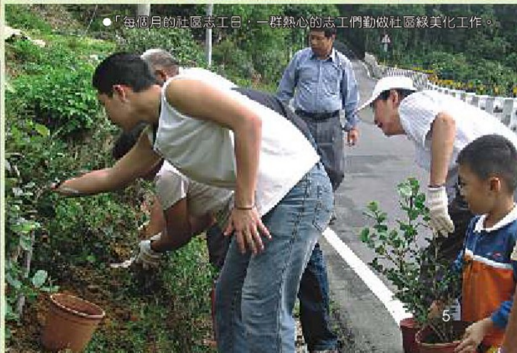
「每個月的社區志工日，一群熱心的志工們勤做社區綠美化工作。」