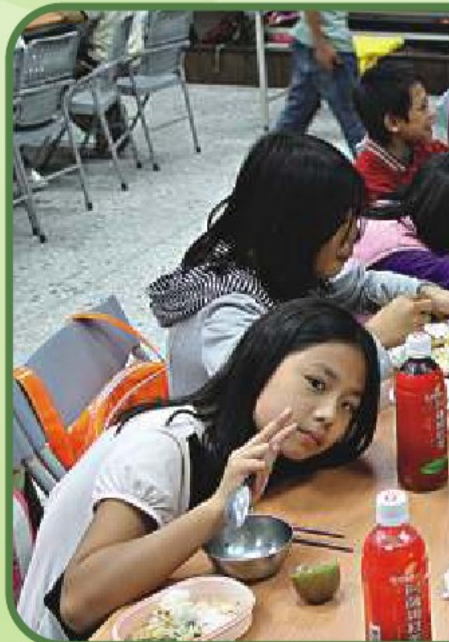
● 西林國小的孩子，晚餐不再是吃些沒營養的垃圾食物。