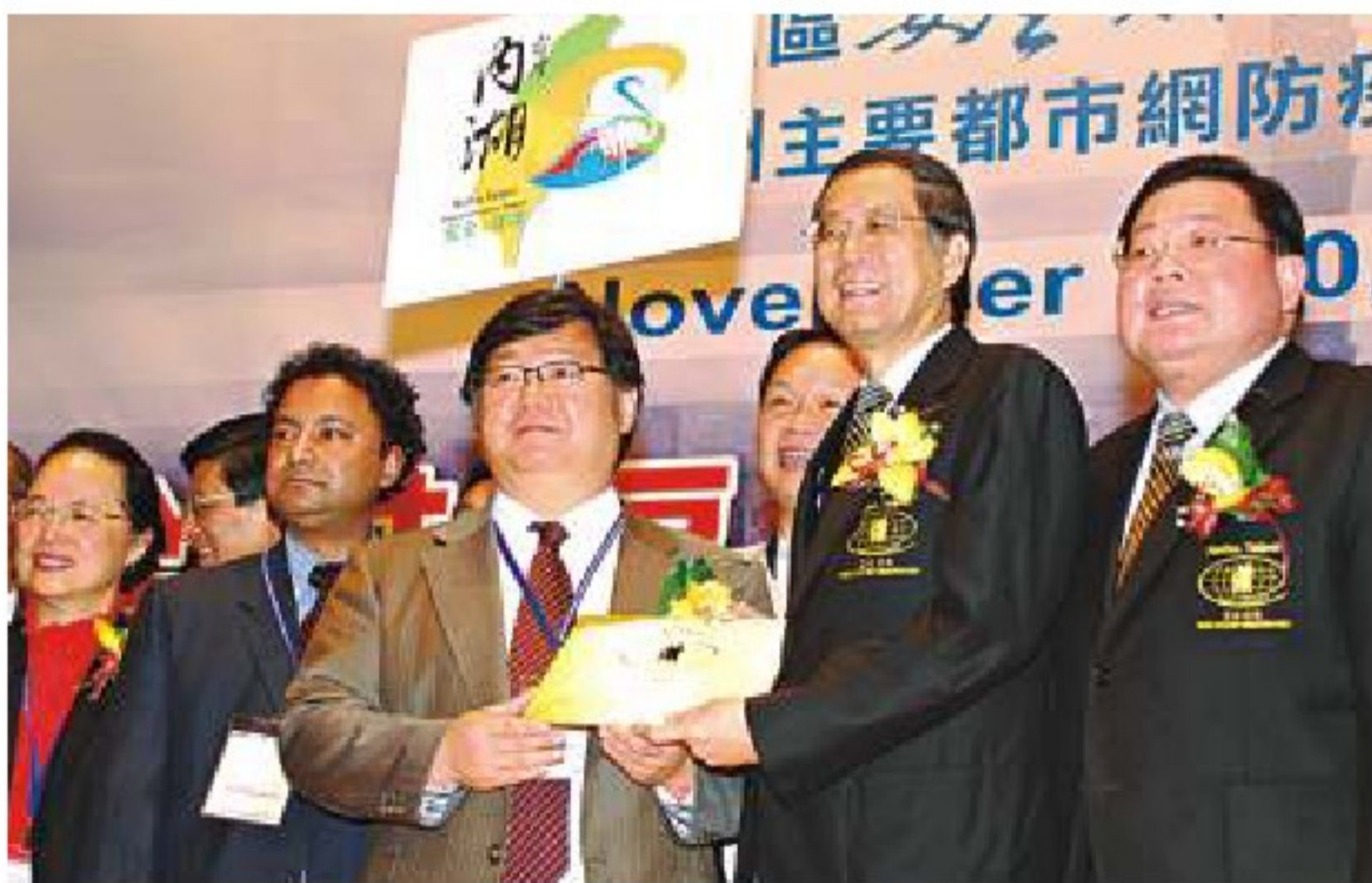
● 頒發「國際安全社區」銅牌儀式

民資源，並成立居住、交通、學校、消費職場、救援及休閒運動安全，以及蓄意性傷害防制等推動委員會；以一個非營利、非政府組織的民間社團，配合一群有愛心、行動力的志工團隊，一起努力付出，共同打造「安全、安康、安適」優